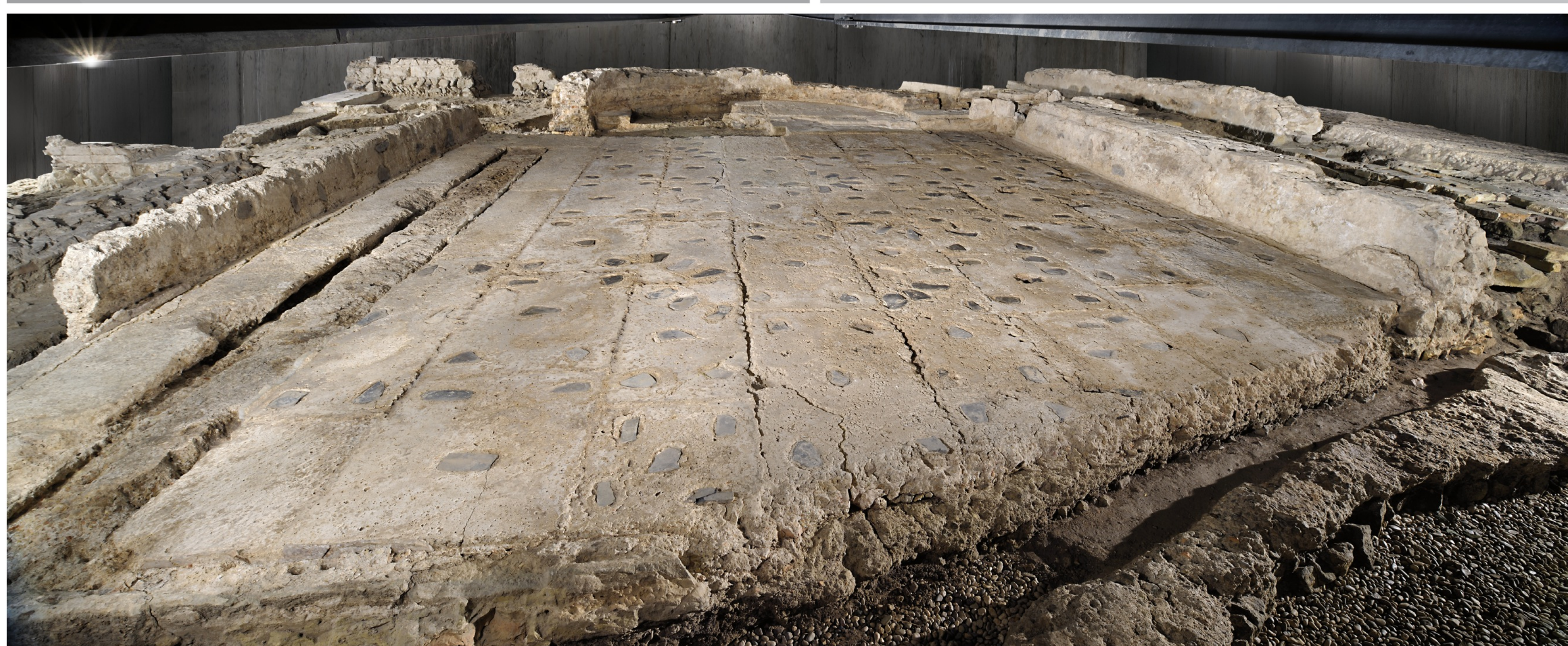
↑ Ausgrabungen und Restaurierungsarbeiten des Thermarkomplexes; Panorama der Apsis von Raum 1 ↑ Excavations and restorations of the bath complex; panoramic photo of the apse in room 1